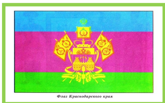
Флаг Краснодарского края

У Кубани есть не только герб, но и флаг. Под флагом сражаются за независимость воины, его поднимают во время спортивных побед, вывешивают во время праздников. У Кубани флаг трехцветный. В центре флага расположен герб Краснодарского края, выполненный в одноцветном варианте – золотым цветом.